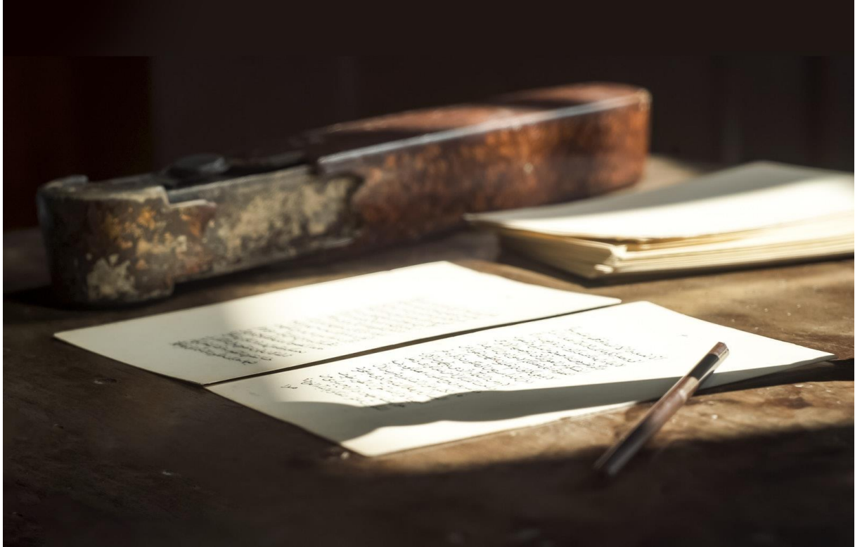
Faksimile av Bahá'u'lláhs originale håndskrift, med hans penn og pennal

Denne korte uttalelse sammenfatter mange av de sentrale læresetningene i bahá'í-troen, hvor en av de viktigste er at ordet skal ta sverdets plass. Bahá'u'lláhs sak vil seire gjennom personen og karakteren til Bahá'u'lláh og ved hjelp av hans penn: ord og deres legemliggjørelse i gjerninger er det eneste middel hvorved Bahá'u'lláhs budskap kan utbres. Følgelig er det muslimske begrepet jihad avvirket, så vel som ethvert begrep om religionen og dens utbredelse som måtte innebære voldsbruk, diskriminering, tvang, samt avstandstagen og hat mot andre. Bahá'u'lláh presenterer kontinuerlig eliminering av religiøs fanatisme, hat og voldsbruk som ett av hovedmålene i sin åpenbaring.