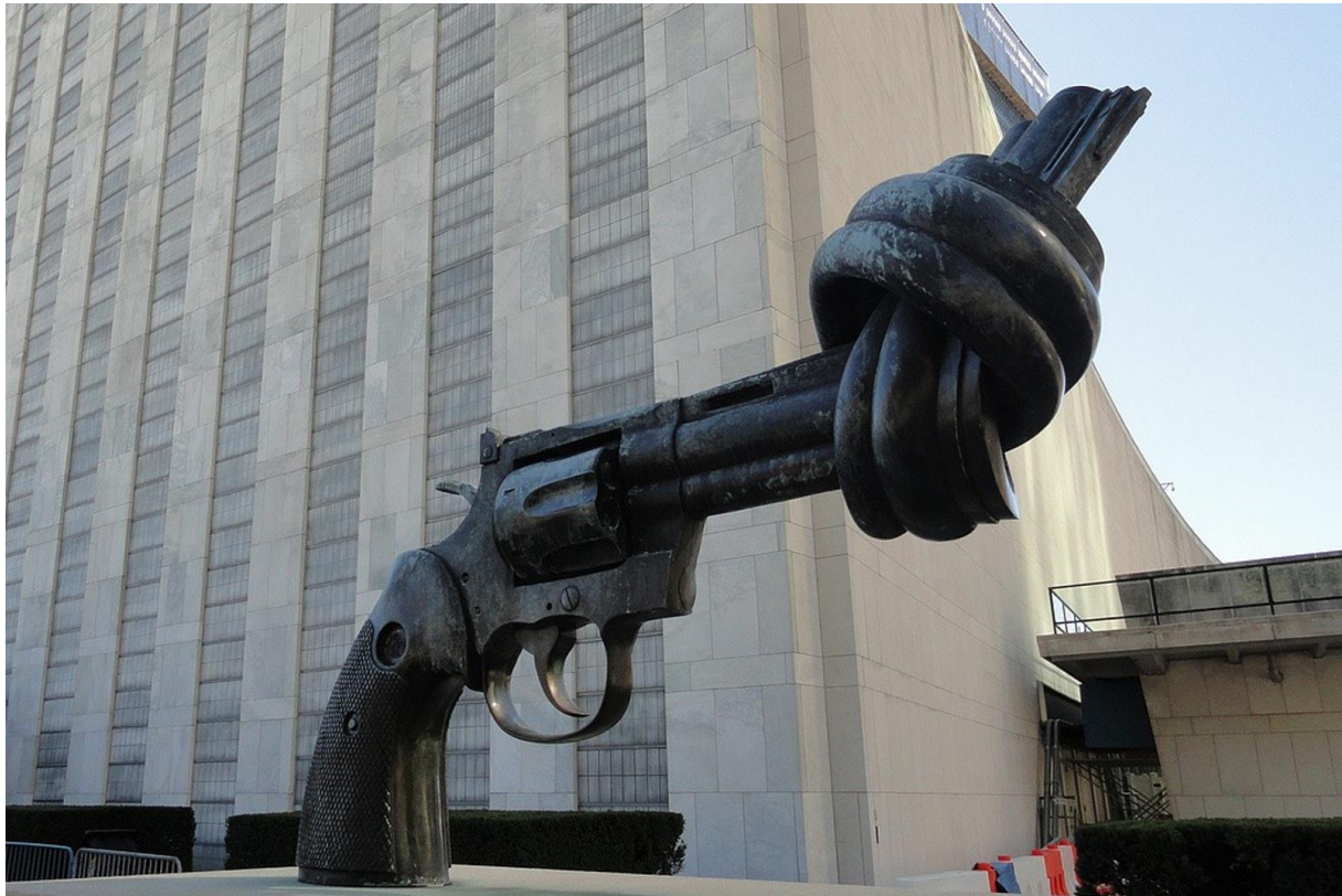
«The Knotted Gun Sculpture» FN's hovedkvarter.