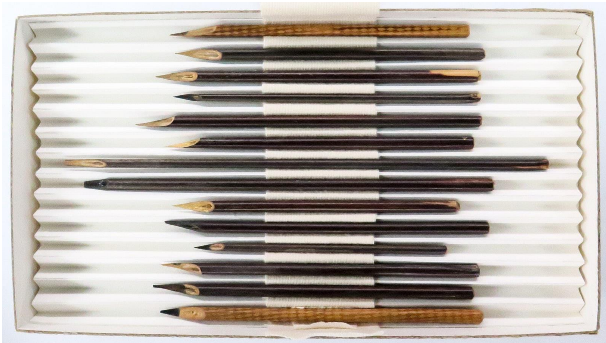
Sivpenner benyttet av Bahá'u'llás sekretærer

rekonstruerer grunnleggende begreper som mystikk, religion og sosial orden; her understrekes det at sverdets kraft må erstattes av ordets makt.