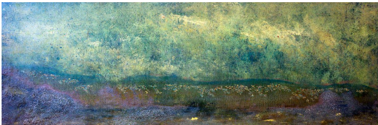
Going to Bahji, by Paula Asadi, 2017