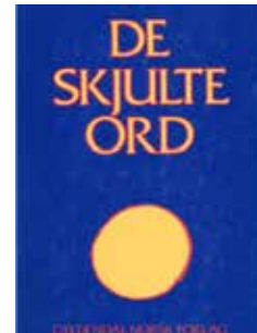
Visdomsord åpenbart av Bahá'u'lláh.

'Abdu'l-Bahás visdom er en samling inspirerende og oppløftende taler, som for det meste ble holdt uformelt og for små forsamlinger under hans besøk i Paris og London i 1912 og 1913.