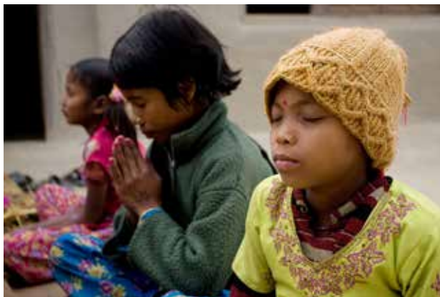
Barn samlet til åndelig samvær i East Kanchanpur, Nepal.

Bønn og meditasjon er viktig for en bahá'í for å kunne utvikle seg som menneske. Bønner skrevet av Báb, Bahá'u'lláh og 'Abdu'l-Bahá inneholder symboler og bilder som hever menneskets ånd mot det guddommelige og det mystiske. Ånden blir opplyst, utvikler seg og blir styrket, og mennesket får kjennskap til ting det ikke visste fra før. Gjennom bønn og meditasjon kan man finne løsninger på