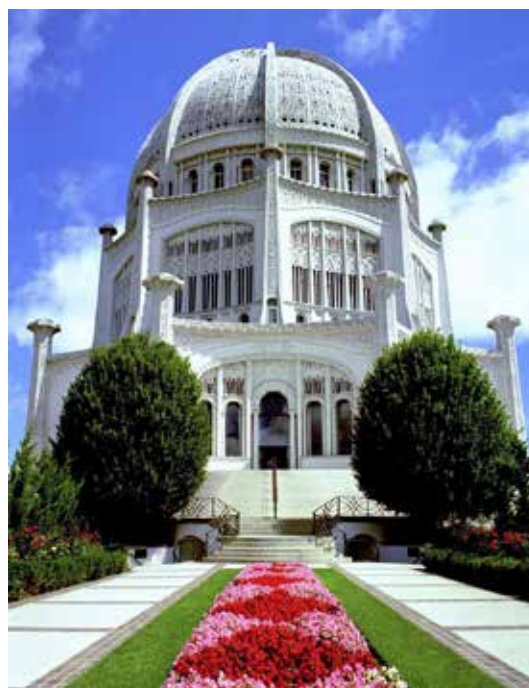
Templet i Willmette i Chicago, USA