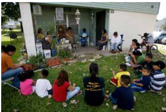
Barn og voksne samlet til bønn og fordypning i Austin, USA.

«O Gud! Opplær disse barn. Disse barn er plantene i din frukthage, blomstene på din eng, rosene i din hage. La ditt regn falle på dem; la virkelighetens sol skinne på dem med din kjærlighet. La din bris forfriske dem så at de kan oppøves, vokse og utvikles og fremstå i den største skjønnhet. Du er giveren. Du er den medlidende.»