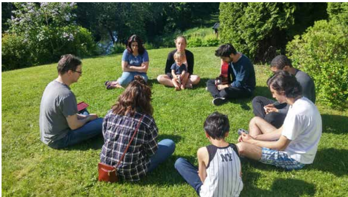
Et utendørs tilbedelsesmøte på Fjellhamar.

En annen vanlig aktivitet i lokale bahá'í-samfunn er regelmessige sammenkomster med bønn, meditasjon og skriftlesning, som ofte holdes hjemme hos bahá'ier. Sammenkomstene foregår uten bestemte ritualer. Deltakerne leser for eksempel skrifter fra forskjellige religioner for å få inspirasjon fra Guds ord. Tilbedelsesmøtene er åpne for alle, uansett livssyn og bakgrunn.