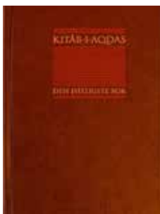
Kitáb-i-Aqdas er hovedboken i Bahá'u'lláhs lære.

'Abdu'l-Bahá skrev flere forklaringer til Bahá'u'lláhs verk. Originalspråkene til bahá'í-troens hellige skrifter er persisk og arabisk, men de er nå oversatt til mange andre språk.