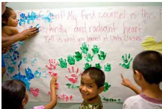
Barneklasse som øver på å fremsi bønn. Austin, USA.

En vanlig aktivitet i et bahá'í-samfunn er klasser for moralsk og åndelig opplæring av barn. Disse klassene er åpne for alle barn, uansett tro og bakgrunn. Hensikten med barneklassene er å vekke og å utvikle den åndelige natur hos hvert barn. Barneklassen begynner med at barna fremsier bønner selv. Så lærer de sitater fra bahá'í-skriftene om åndelige egenskaper og synger sanger.