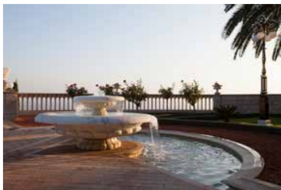
Fontene på en av terrassene til Bábs gravmæle.

Religion bør være årsak til kjærlighet og hengivenhet. Kjærlighet er en sterk kraft.