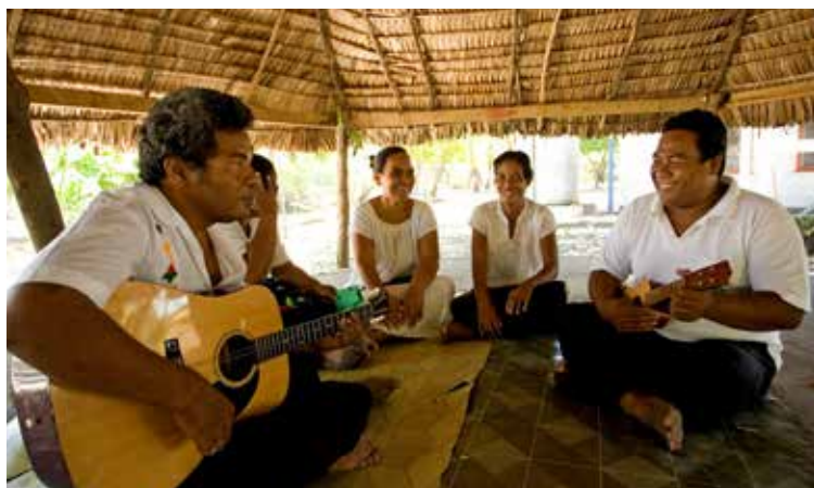
En sammenkomst med bønn og sang i South Tarawa, Kiribati.

Der er ingen annen Gud enn deg, hjelperen i fare, den selvbestående.» – Bahá'u'lláh