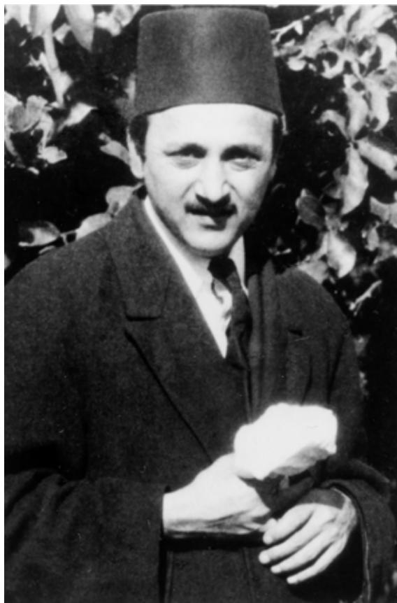
Shoghi Effendi var hans eldste barnebarn og dattersønn av 'Abdu'l-Bahá. 1897 - 1957

For å beskytte og administrere bahá'í-troen ble det etter hvert dannet lokale, nasjonale åndelige råd og ett internasjonalt råd.