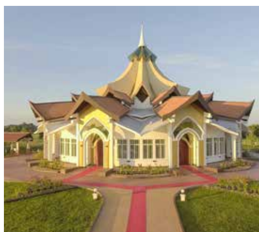
Templet i Battambang, Cambodia