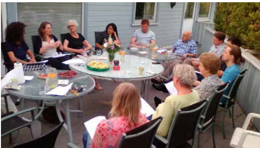
Et rådslagningsmøte på bahá'í-senteret i Oslo.

Bahá'í-troen ser på rådslagning som et fundament for en ny verdensorden. Rådslagning er et viktig verktøy for et godt samarbeid. Alle må respektere hverandre og lære å arbeide sammen i harmoni for et felles ideal. I en rådslagning skal alle få anledning til å uttrykke sin mening. Man prøver å oppnå en løsning som alle kan enes om. Hvis man ikke blir helt enige i en sak, tar man en avstemning. Et prinsipp i bahá'í-troen er at når beslutningen er tatt, følger alle lojalt opp vedtaket med tanke på å ivareta enhet.