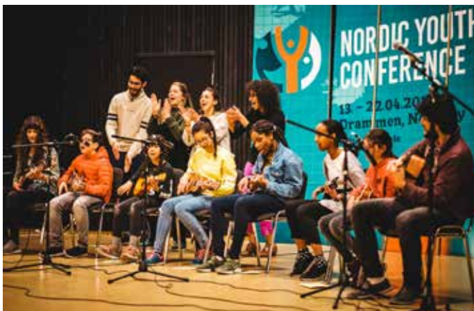
Ungdommer på Nordisk Bahá'í Ungdomskonferanse i Drammen.

Mange lokale bahá'í-samfunn tilbyr bahá'í-inspirerte fritidstilbud for ungdom i alderen 12–15 år. Opplegget tilbys over hele verden og kalles Åndelig styrking av juniorungdom . De er i likhet med barneklassene åpne for alle, uansett bakgrunn, og fokuserer på utviklingen av åndelige egenskaper, intellektuelle ferdigheter og evne til tjeneste for fellesskapets beste. Målet med ungdomsgrupper er å styrke selvbildet og gi ungdommene den kunnskap og de ferdigheter de trenger for å kunne tjene samfunnet og menneskeheten. Ungdommene deltar i rådslagning/konsultasjon, drama, studier av bahá'í-inspirerte tekster, formingsaktiviteter, sport og tjenesteaktiviteter for lokalsamfunnet. Tjenesteaktiviteter kan være alt mulig som juniorungdommene selv velger, for eksempel å plukke søppel, støtte veiledere i barneklasser og til å hjelpe de eldre i nabolaget.