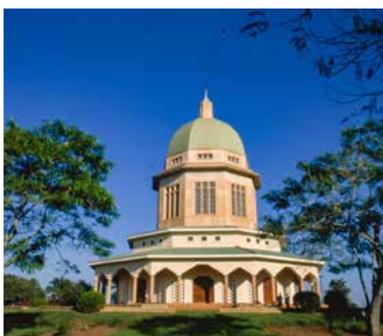
Templet i Kampala, Uganda