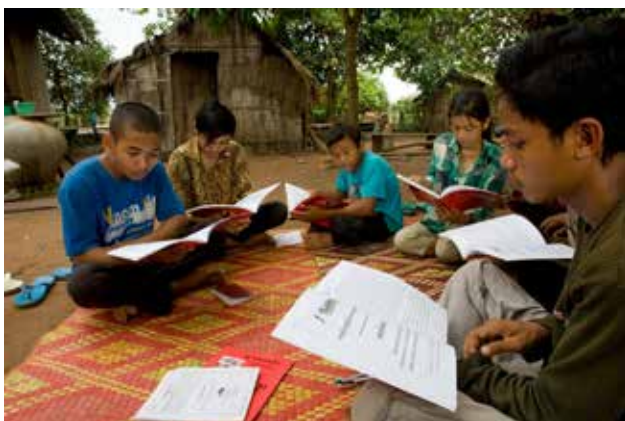
Bahá'í studiesirkel, Fjellhamar i Preah Vihear, Cambodia.

Bahá'í-samfunnet tilbyr også kurs for eldre ungdommer og voksne, åpne for alle. Ett av kursene, «Refleksjoner over åndens liv», handler om åndelig utvikling og praktisk anvendelse av åndelige verdier. Kurset er basert på bahá'í-troens skrifter og tar for seg emner som meningen med livet, sjelens natur, positive verdier og etisk oppførsel, bønnens åndelige dynamikk, perspektiver på liv og død og menneskets forbindelse med Gud . Kursene består hittil av ti hefter som handler om forskjellige emner, og er under utvikling.