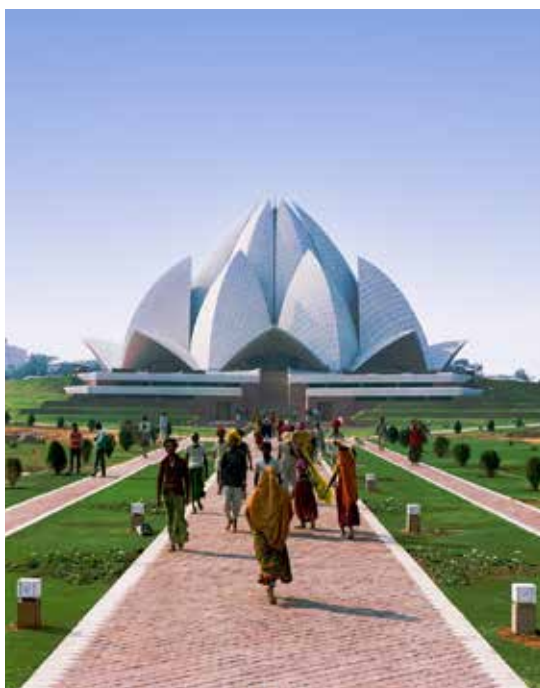
Lotustemplet i New Delhi, India

Nedenfor er eksempler på noen av templene.