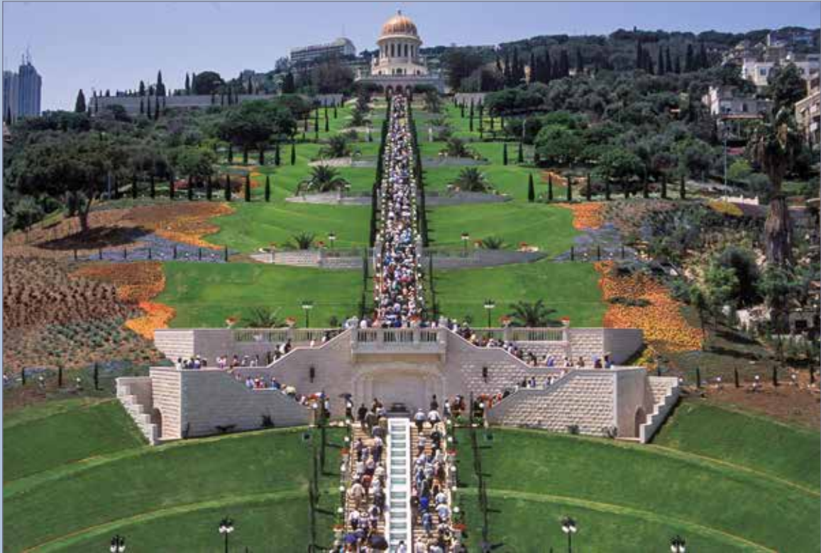
Deltakere fra hele verden vandrer opp Karmelfjellet under åpningen av terrassene til Bábs gravmæle, 23. mai 2001

«Verdensfred er ikke bare mulig, men uunngåelig. Den utgjør neste stadium i denne planetens utvikling»