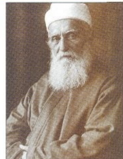
SØNNEN: Da grunnleggeren Bahá'í'lláh døde i 1892, overdro han til sønnen 'Abdu'l-Baha ledelsen av bahá'í. Han ligner lot sitt eldste barnebarn overta arven i 1921.

Den livsstil som B. søkte å fremleke, oppmuntrer til egen utvikling. Daglig bønn og ettertanke skal befri sjelen fra innlærte manstre og åpne for nye muligheter. Alkohol eller narkotiske stoffer avholder man seg fra, fordi disse stoffene til slutt sløver sinnet. Det gjør også bakslutelse, som svekker tilliten mellom mennesker og undergraver den enhetsånden som menneskelig fremgang er avhengig av. Skilsmisse frarådes, men er ikke forbudt.