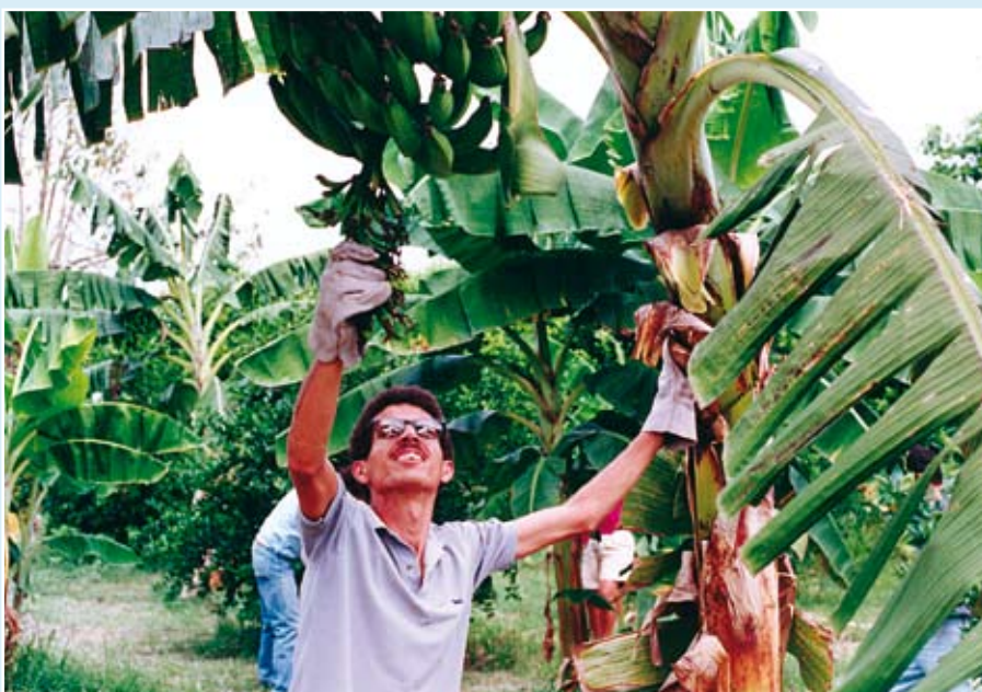
▲ FUNDAECs arbeidsmetoder gjør det mulig for lokalsamfunn å generere og anvende vitenskapelig kunnskap for å sette fokus på lokale behov og bidra til forandring av samfunnet.

direkte, har FUNDAEC også – ved hjelp av et etterutdanningsprogram som kalles “Utdanning for utvikling” – gjort det mulig å bidra til at andre organisasjoner kan anvende tilnæringsmåtene til Universidad para el Desarrollo Integral (Universitetet for integrert utvikling) i sine egne programmer og prosjekter: på en effektiv måte å styrke folks motivasjon og streben etter å ta ansvar for sin egen utvikling, å bygge lokale institusjoner – noe som er vesentlig hvis samfunn på landsbygda ikke skal feies unna eller assimileres av globaliseringsprosessen, å legge vitenskapens kraft i hendene på folk på landsbygda slik at de kan bli forkjempere innen det kollektive foretak som genererer og anvender ny kunnskap, og å forene vitenskapens og religionens kunnskapssystemer i undersøkelsen av virkeligheten og forvandlingen av samfunnet.