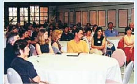
▲ En offentlig diskusjon om ulike samfunnstemaer organisert av bahá'í-samfunnet i Perth, Australia.

■ I et forsøk på å hjelpe innsatte fanger til å snu om på livene sine, har en gruppe bahá'íer i USA utviklet et kurs, "Vellykket egenveiledning", som resulterer i et betydelig fall i antall gjentatte lovovertrедelser blant dem som har fullført kurset.