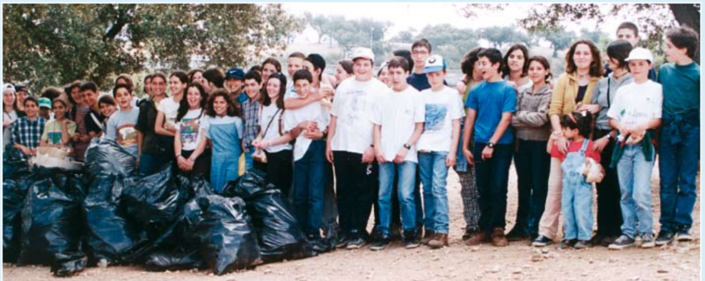
▼ "Ren dam, levende vann" – en kampanje i Évora, Portugal.