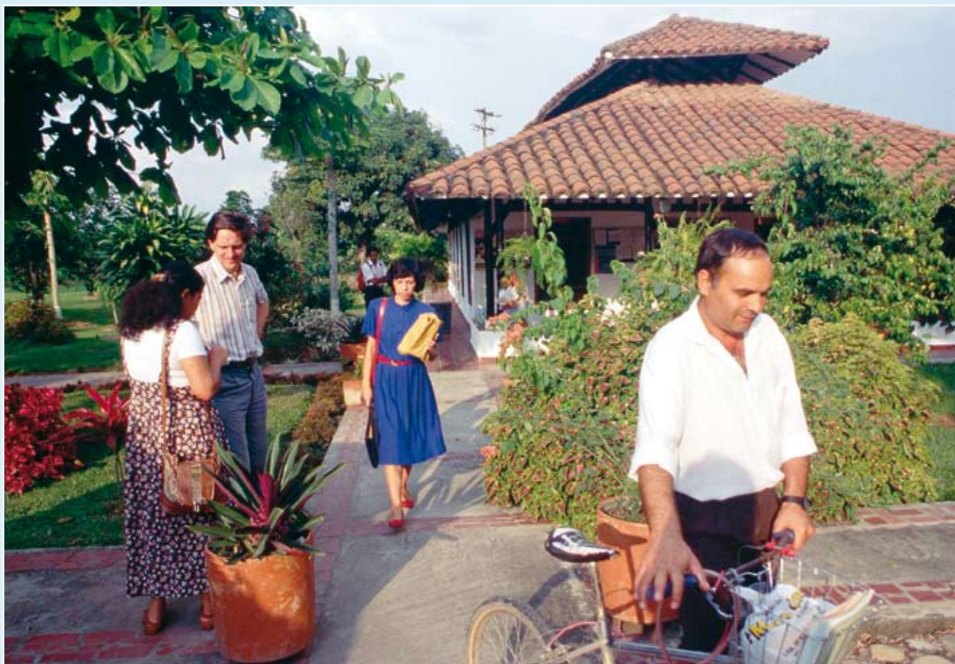
▲ Universitetsområdet hvor FUNDAEC-programmer på universitetsnivå blir holdt.

direkte, har FUNDAEC også – ved hjelp av et etterutdanningsprogram som kalles “Utdanning for utvikling” – gjort det mulig å bidra til at andre organisasjoner kan anvende tilnæringsmåtene til Universidad para el Desarrollo Integral (Universitetet for integrert utvikling) i sine egne programmer og prosjekter: på en effektiv måte å styrke folks motivasjon og streben etter å ta ansvar for sin egen utvikling, å bygge lokale institusjoner – noe som er vesentlig hvis samfunn på landsbygda ikke skal feies unna eller assimileres av globaliseringsprosessen, å legge vitenskapens kraft i hendene på folk på landsbygda slik at de kan bli forkjempere innen det kollektive foretak som genererer og anvender ny kunnskap, og å forene vitenskapens og religionens kunnskapssystemer i undersøkelsen av virkeligheten og forvandlingen av samfunnet.